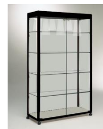
ART. 100/A cm. 100x52xH195 top con illuminazione - top with lighting