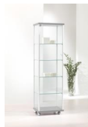
Art. 53/A cm 53x39xh 183 colore silver – silver colour 4 ripiani – 4 shelves, 2 faretti alogeni nel top – 2 halogen downlights