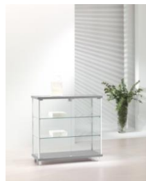
Art. 93/B cm 93x39xh 92 colore silver – silver colour 2 ripiani – 2 shelves 3 alogeni laterali – 3 halogen side lights