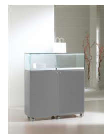
Art. 100/SPECIAL cm 100x42xh 103 colore silver – silver colour teca h cm 20 – h 20 cm glass case 2 alogeni laterali – 2 halogen side lights