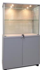
Art. 160/SPECIAL cm 100x42xh 160 colore silver – silver colour teca h cm 80 – h 80 cm glass case 4 alogeni nel top – 4 halogen downlights