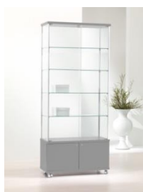
Art. 93/MA cm 93x39xh 220 colore silver – silver colour 4 ripiani – 4 shelves, 6 faretti alogeni nel top – 6 halogen downlights