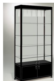
ART. 100/MA5 cm. 100x52xH220 mobile di base – ground furniture ; top con illuminazione - top with lighting