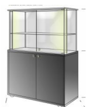
ART. 100/45 cm. 100x45xH160 mobile di base H100 - ground furniture h100 ; teca H60 – techa h60; n. 2 strisce led laterali – n. 2 halogen side lights