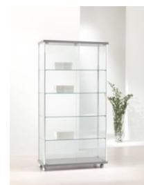
Art. 93/A cm 93x39xh 183 colore silver – silver colour, 4 ripiani – 4 shelves, 6 faretti alogeni nel top – 6 halogen downlights