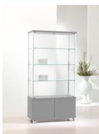
Art. 93/M cm 93x39xh 183 colore silver – silver colour, 3 ripiani – 3 shelves, 6 faretti alogeni nel top – 6 halogen downlights