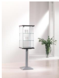
Art. 3/PF cm 45x45xh 158 colore silver – silver colour 2 ripiani – 2 shelves piantana h 74 cm – h 74 cm pedestal